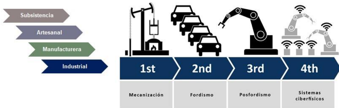
Figura 3.1 Formas de producción

No es nuestro objetivo desarrollar en extenso cada una de las formas de producción previas al capitalismo, pero podemos decir que a medida que cada una de ellas se fue perfeccionando y evolucionando tecnológicamente las cantidades producidas crecieron y con ello el intercambio, motorizado también por el aumento de la demanda, sostenida en el largo plazo por el crecimiento demográfico.